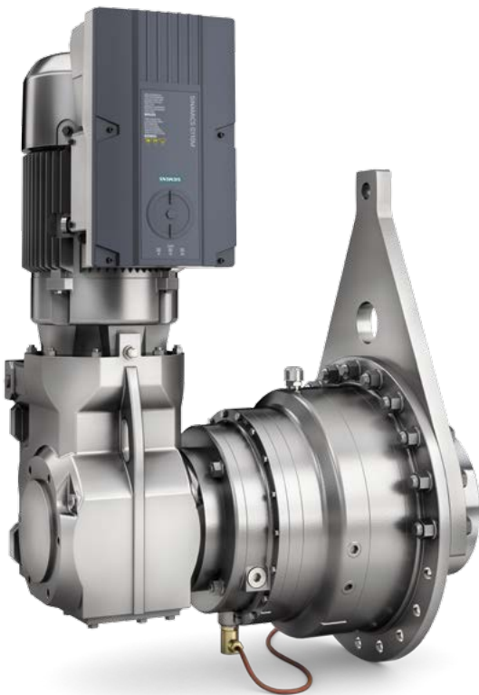
Für optimale Ausnutzung der Getriebeleistung: vollintegriertes 5-stufiges FLENDER SIP im Siemens-Antriebsstrang

Bei Ihrer Anlagenplanung sollte die Auswahl des richtigen Antriebs vor allem eins sein: einfach. FLENDER SIP hilft Ihnen mit starken Produkten in einem ausgewogenen Programm. Doch wir haben noch einen entscheidenden Faktor mehr zu bieten: den Antriebsstrang. Profitieren Sie von den maßgeblichen Vorteilen von Siemens Integrated Drive Systems: